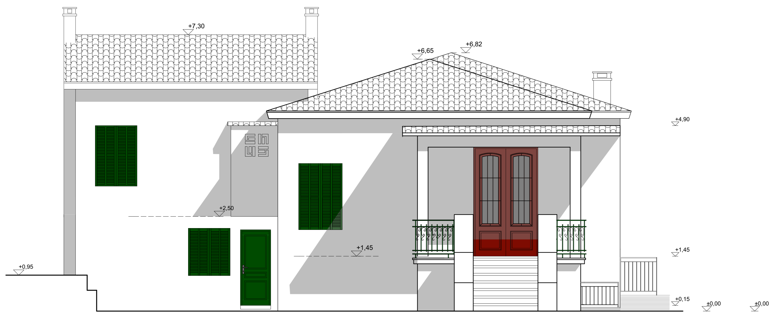
ΟΨΗ Α - ΠΡΟΣΟΨΗ